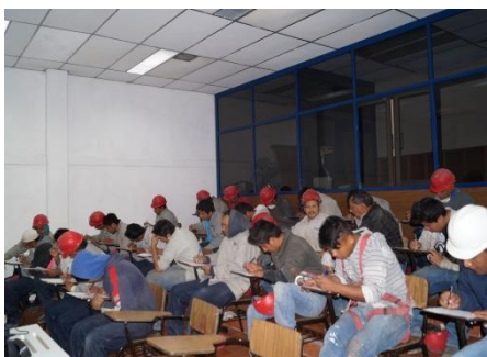
Empleados de la planta Tlaxcala respondiendo un cuestionario para conocer su nivel educativo.

Se preparan para presentar 22 exámenes para obtener su certificado de preparatoria.