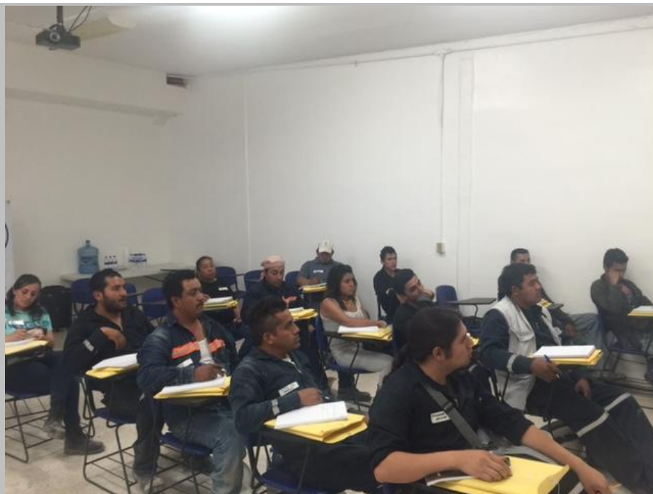
EDUCACIÓN, CIMIENTO DE UN FUTURO MEJOR